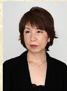
スペシャルトークショー 「人生の楽しみ方」 小説家 唯川 恵 氏

日時 平成30年9月23日（日・祝） 場所 金沢東急ホテル 5階「ボールルーム」 金沢市香林坊2-1-1 TEL：076-231-2411