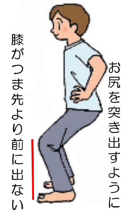
スクワット 太もも・お尻